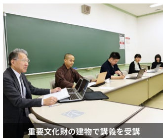
重要文化財の建物で講義を受講