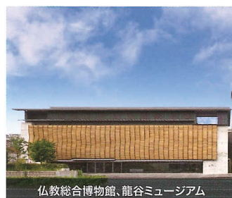
仏教総合博物館、龍谷ミュージアム