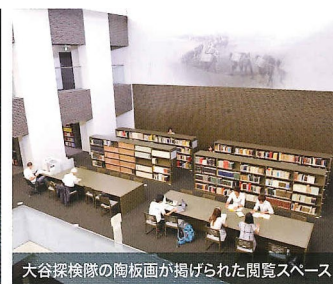
大谷探検隊の陶板画が掲げられた閲覧スペース