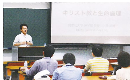
K-GURS加盟大学教員によるチェーンレクチャー

K-GURS加盟大学では、それぞれの宗教・宗派の特色を活かした教育プログラムを展開し、次世代の宗教研究者や宗教指導者など、宗教に関するプロフェッショナルとなる人材育成を行っています。