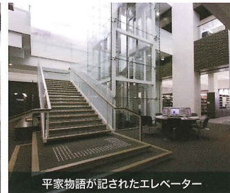
平家物語が記されたエレベーター