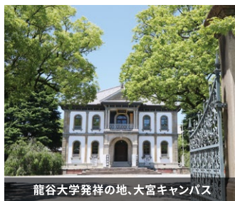
龍谷大学発祥の地、大宮キャンパス