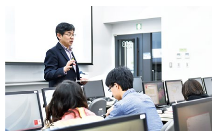
アカデミック・ライティング

全専攻の大学院生が受講できる語学科目として、大学院生に求められる高度な教養としての外国語能力を養成する「英語(リーディング)」、「英語(ライティング)」、学位論文をはじめとする学術論文を作成するにあたって必要とされる文章表現力や論理的思考力を養成する「アカデミック・ライティング」を開設しています。