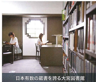
日本有数の蔵書を誇る大宮図書館