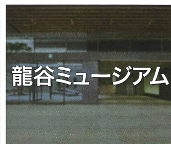
龍谷ミュージアム