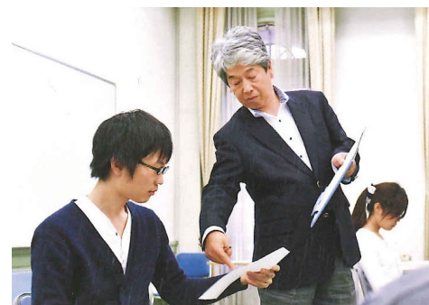
経験豊富な教員による指導

歴史・文化的な遺産としての「もの」を扱う考古学と共に、美術史学・文化財保存・修復学分野が加わり日本史学専攻が充実しました。