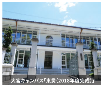
大宮キャンパス「東翼(2018年度完成)」

1936(昭和11)年竣工、2006(平成18)年にリニューアルオープンした大宮図書館。『類聚古集』(国宝)、『李柏尺牘稿』(重要文化財)、『解体新書』(初版本)、現存最古級の世界地図である『混一疆理歴代国都之図』など、和漢の古典籍を中心とした貴重な資料をはじめ、真宗学、仏教学、哲学、歴史学などの分野を中心とした人文科学系の蔵書数は約73万冊にのぼります。龍谷大学全体では、219万冊以上の蔵書数を誇り、龍谷大学以上の蔵書がある図書館を有する大学は、日本ではごく僅かという恵まれた環境での研究が可能です。