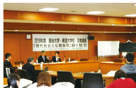
東国大学校との交換講義

また、東国大学校(韓国)との交換講義を実施しているほか、海外の大学院との学術交流も行っています。