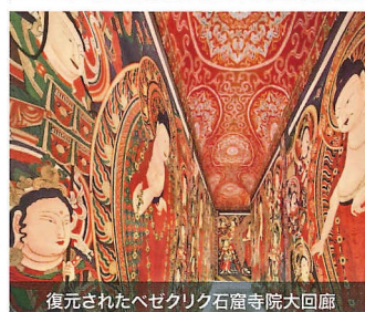
復元されたベゼクリク石窟寺院大回廊