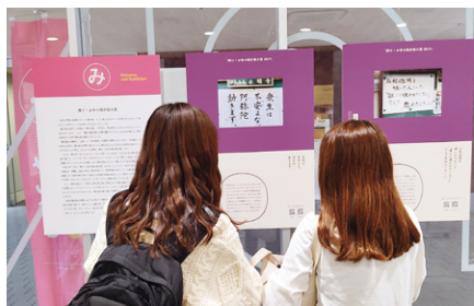
ユナスソーシャルビジネスリサーチ センター主催「みんなと仏教」展を開催

2020年12月に開催された第27回スポーツチャンバラ全日本学生選手権大会において、一般同好会スポーツチャンバラサークル龍刃会が男子団体戦で昨年敗れた明治大学にリベンジを果たし、見事優勝。全国大学の頂点に立った。女子団体戦も全国3位と初入賞の快挙を遂げた。大会には13名の部員が出場し、個人戦でも優勝や準優勝など数々の賞を獲得した。