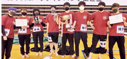
スポーツチャンバラサークル龍刃会 全日本学生選手権大会 男子団体戦で優勝

2020年12月に開催された第27回スポーツチャンバラ全日本学生選手権大会において、一般同好会スポーツチャンバラサークル龍刃会が男子団体戦で昨年敗れた明治大学にリベンジを果たし、見事優勝。全国大学の頂点に立った。女子団体戦も全国3位と初入賞の快挙を遂げた。大会には13名の部員が出場し、個人戦でも優勝や準優勝など数々の賞を獲得した。