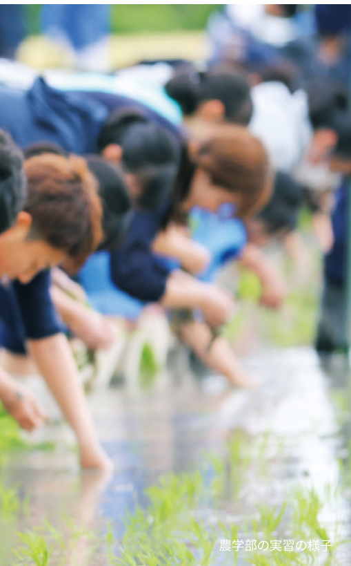
農学部の実習の様子