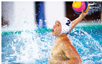
関西学生秋季水球競技大会で優勝

2020年10月に京都アクアリーナでおこなわれた2020年度関西学生秋季水球競技大会において、水上競技部(水球部門)が優勝。今年3連覇がかかっていた関西学生選手権は中止となり、その代替として本大会は無観客での開催となった。わずか2カ月の練習期間で活動内容・時間が制限されるなか、これまで培ってきたチーム力で見事優勝をつかみ3連覇を達成した。