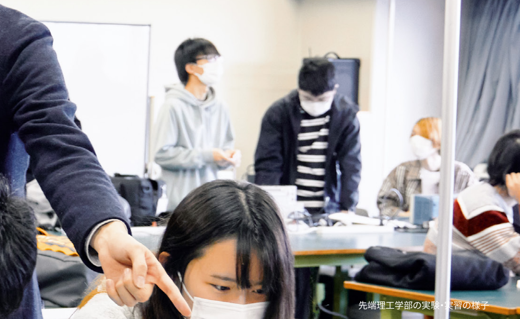
先端理工学部の実験・実習の様子