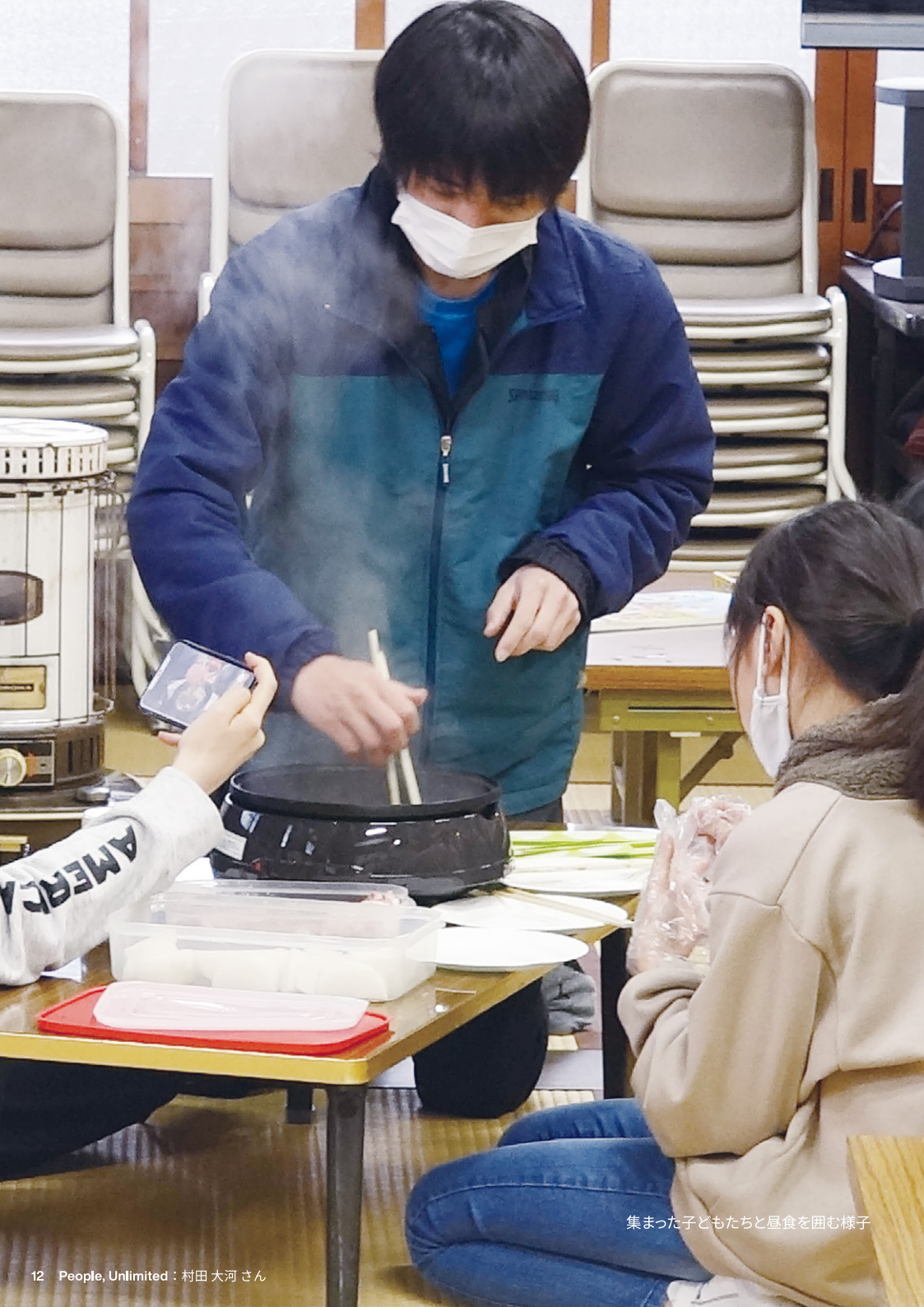
集まった子どもたちと昼食を囲む様子