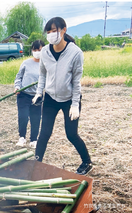
竹炭を作る学生たち