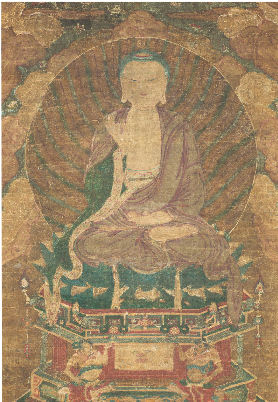
如来像 中国元~明時代(14~15世紀)