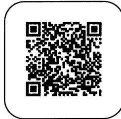
追手門学院 大手前 中・高等学校