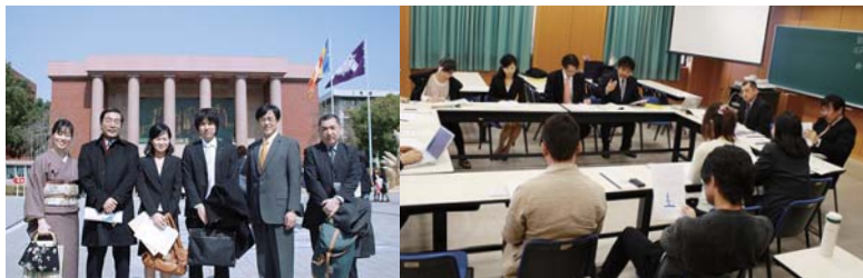
卒業式での集合写真と報告会の様子

卒業生のみなさん、ご卒業おめでとうございます。卒業式の後で先輩方の報告をお伺いしました。私は早期履修生として、特別演習の講義を通して研究過程を拝見していましたが、最終的にはこのようになったのかと驚きや発見がありました。また修士論文の執筆に向けて参考になります。この1年間は常々、修士論文の執筆に苦しまれる先輩方の姿を拝見しておりましたが、卒業式この日はみなさんとてもすがすがしい表情をされていて私もほっとしました。ここでの経験を活かして現場でも今後ますます活躍されることと思います。本当にお疲れさまでした。