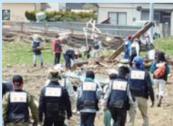
大きながれきを撤去

京都災害ボランティア支援センターでは、被災地に対する支援のほか京都に避難されてきた方々への支援も行っています。ボランティアバス第1陣では、定員90人に対して460人の応募があるなど、従来の災害支援とは異なる関心の高さ、広がりを感じています。また、センター運営も多くのボランティアによって成り立っています。求められる支援を継続して行うことが重要だと思って活動しています。