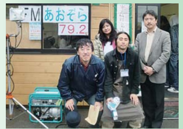
宮城県亶理町の臨時災害FM局「FMあおぞら」