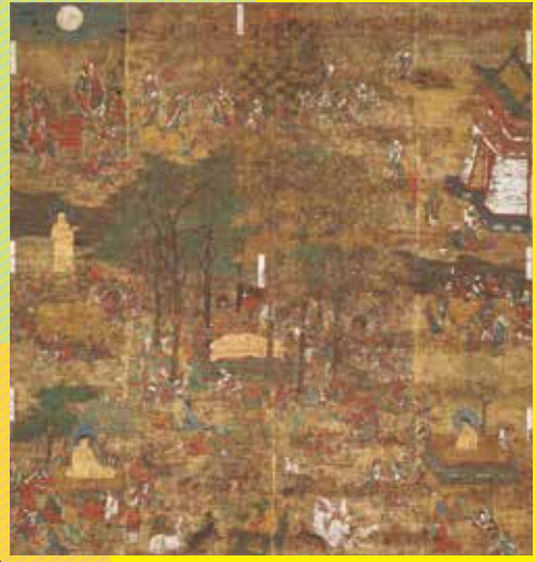
重要文化財 涅槃変相図 鎌倉~南北朝時代(13~14世紀) 岡山・遍明院 【展示期間5/22~6/17】