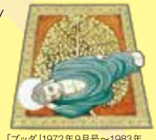
「ブッダ」1972年9月号~1983年12月号「希望の友」少年ワールド~「コミックム」連載 ©手塚プロダクション

「マンガの神様」といわれた手塚氏は、ブッダ=釈迦の一生の事績を仏伝などに取材しながら、独自の解釈を交えて、雄大な構想のもとに「ブッダ」を描きました。手塚氏の生誕90周年を記念し、本展では直筆の原画も展示します。