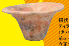
鐙状口縁鉢 ティラウラコット (ネパール) 前5~前4世紀 立正大学博物館