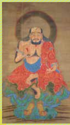
釈迦三尊像(部分) 伝顔輝筆 中国・元時代(14世紀) 京都・鹿王院 【展示期間4/21~5/20】