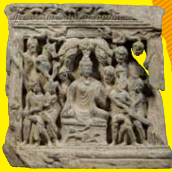
仏伝浮彫 「降魔成道」 ガンダーラ 2~3世紀 兵庫・永澤寺