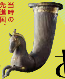
馬形リユトン 中央アジア 前4世紀 MIHO MUSEUM