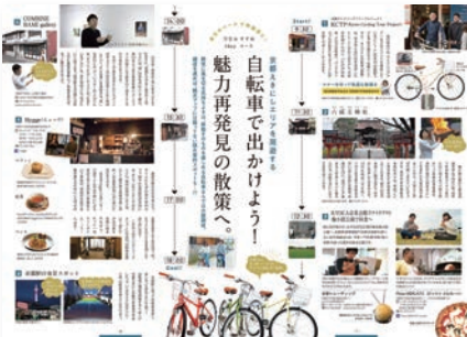
(5) P7-8 取材企画テーマ：京都えきにしエリアを周遊する 取材先：京都サイクリングツアープロジェクト、六孫王神社、京果トレーディング、Pizza MERCATO、COMBINE BAMI gallery、Hygge ほか