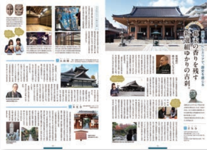
(2) P1-2 取材企画テーマ：京都えきにしエリアで、歴史を感じる 取材先：壬生寺、太鼓楼(西本願寺)、本光寺