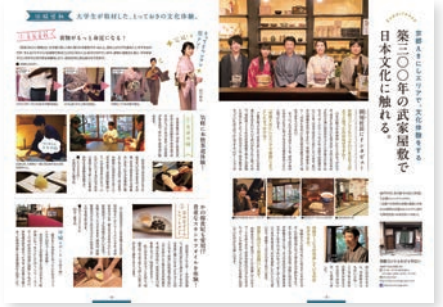
(3) P3-4 取材企画テーマ：京都えきにしエリアで、文化体験をする 取材先：京都コンシェルジュサロン