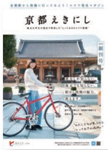
(1) 表紙写真 撮影場所：壬生寺