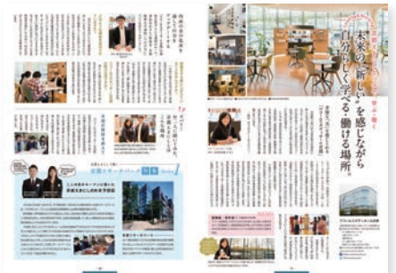
(6) P9-10 取材企画テーマ：京都えきにしエリアで、学ぶ・働く 取材先：ワコールスタディホール京都、(株)ワコール、京都リサーチパーク(株)