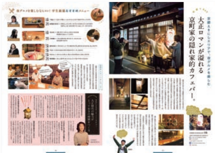
(4) P5-6 取材企画テーマ：京都えきにしエリアで、夜グルメを楽しむ 取材先：CafeBar & Restaurant の輪