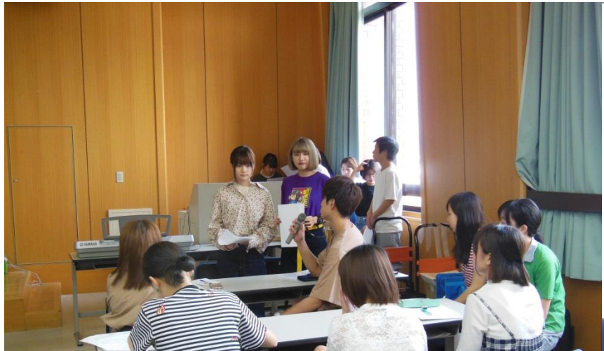
フロアーの学生に問いかけ