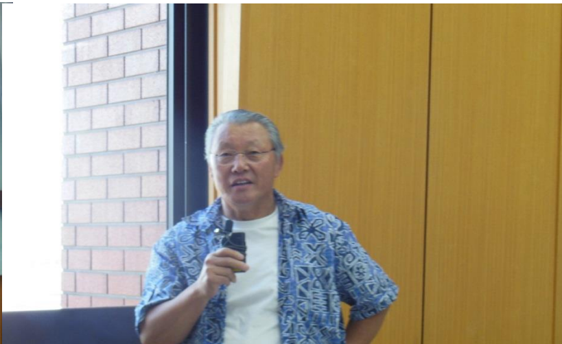
フロアーの教員からの質問