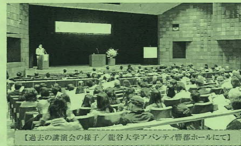
【過去の講演会の様子 / 龍谷大学アバンティ警都ホールにて】