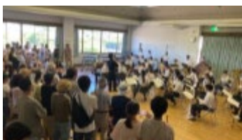
瀬田北中学校吹奏楽部の 演奏によるオープニング アクト