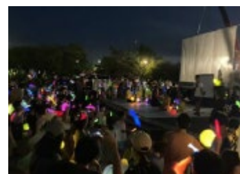
瀬田東小学校夢プロジェクト