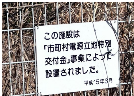
「特別交付金によって設置された」という看板

しかしながら、原子力発電所があったからこそ財源が安定し、設備の整った施設を使用することができたという自治体もあるそうです。大熊町はその一つで、「電源立地地域対策交付金」というものが支給されていたと言います。そのため児童館に床暖房が完備されているなど他の地域と比べて公共施設の設備が整っていたそうです。