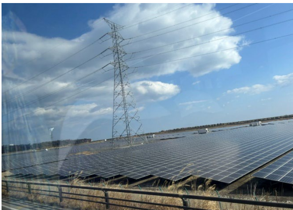
車窓から見た太陽光パネルが広がる風景

2つ目は、便利と犠牲は紙一重ということだ。私たちの生活は都合の良いところばかりで、その便利な生活の裏にある犠牲に目を向けていない。福島の街を見たときに、街のいたる所が太陽光パネルで敷き詰められていた。また発電所なども多くあり、とても異様な光景だと感じた。だがこれが、私たちの便利な生活が生み出した結果なのだ。世