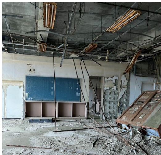
震災遺構 請戸小学校の教室

当時小学生で被災して、10年後の思いを綴った言葉があった。「自分の人生好きなことをやりたいように生きる。それが誰かのためになるのでいいと思う。結局ものは言いよう考えよう。」請戸小学校の校舎とその言葉を見た時、被災から10年という月日で元の生活を手に入れられた人なんてきつとなくて、つらい思いをしてきた中で前を向こうとしている人がいることにはっと気づいた。悲惨な経験をしたからこそ、誰のためでもなく、自分の人生を自分で定義されたその言葉が、私に深く響いた。これまでの私は周りを気にして、他のこ