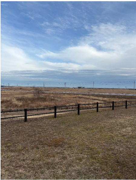
大平山霊園からの景色

しかし、その一方で「実際の震災や津波」に対して具体的なイメージを持っておらず、どこか自分事になりきれていないのではないかと感じていた。自分の目で、災害が起きるとどうなるのか見てみたいと考え、このスタディツアーへの参加を決めた。