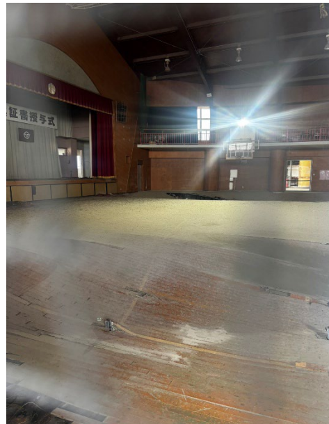
震災遺構請戸小学校の体育館

また津波の被害にあった請戸小学校の看板に 書かれていた言葉は、「復興とは、復興のことを考 えなくなる」と書かれていた。現在、災害遺構 を残すかどうか議論がされているが、私は災害遺 構を残すという事は必要であると考えます。災害遺 構は震災のつらい気持ちをかき立てる場所では あるが、そこで生活していたという証であり、人々 の帰る場所なのである。それを消してしまうと故 郷の風景がなくなるのである。そのため、これか らも災害遺構を残し続けて、後世に災害の恐ろし さを伝えながらも当時の人々の帰る場所にもなっ てほしいと考える。町を復興させるために新たに 整備・建設され、多少姿形が変わるのは仕方が無 いことではあるが、出来れば本来の姿に近づけて 戻せたらいいと思う。