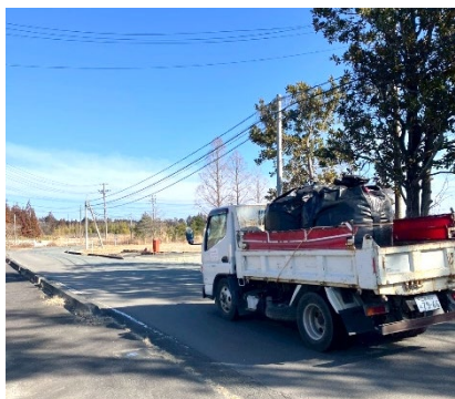
バスを降りたときに通り過ぎて行ったトラック

中でも、最終日に訪問した中間貯蔵施設でバスの中から見た景色が今も強く印象に残っている。住民の姿はないが、木々や鳥などの自然は静かにそこに生きていた。その一方で、人間が手を加えた建物や土地だけが取り残されたように感じられた。