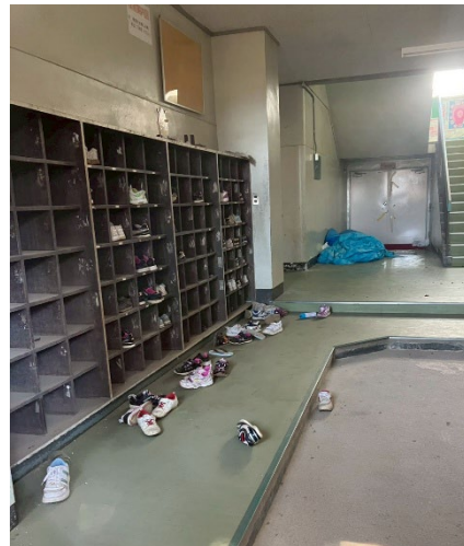
震災当時のままの大熊小学校

たことがある。「想定外という言葉は責任逃れに使われる」という指摘である。災害や事故の際に想定外という言葉が用いられることは多いが、日本に住んでいれば災害はいずれ起こる可能性があることは誰もが理解している。また、災害や事故には常に人命が関わる。だからこそ、本来はどこまで想定し、どのように備えるべきだったのかという議論が必要である。しかし「想定外」という言葉が用いられることで、その議論が十分に行われないまま責任の所在が曖昧になってしまうのではないかと感じた。現地で生活してきた人の言葉としてこの指摘を聞いたとき、これまで何気なく聞いていた想定外という言葉の重さを改めて考えさせられた。