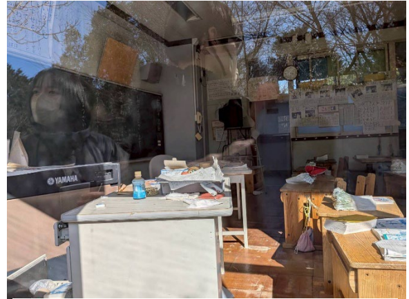
窓から見た熊町小学校の教室

の中はすべて綺麗事だけではない。便利な背景には何があるのかを学ぶべきである。そして、綺麗事だけではなく都合の悪い部分も見続ける責任がみんなにもある。