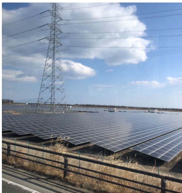
広大な広さでソーラーパネル

私はこれまで、能登半島の災害ボランティアプログラムに参加し、インフラ復旧の現場や地域の「復興」を目指す取り組みに関わる機会を得てきた。また、能登半島地震の支援活動に参加した際、同じ被災者であっても「復興」の受け止め方や必要とする支援が一人ひとり異なることを実感した。災害の種類や規模、地域性によって状況は大きく異なるが、震災から15年の年月が経った福島の現在はどうのような姿なのか、また震災と原発事故という大きな困難の中で地域がどのように歩んできたのか、を自分の目で確かめたいと考え、本スタディーツアーに参加した。実際に現地を訪れ、語り部の方々の言葉に直接触れることで、これまでニュースや資料を通して知っていた福島とは異なる、地域の「今」の姿を感じることができた。