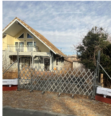
空き家の前にバリケードが設置されている

していくのを見て怖くなりました。アスファルトや金属、植物など、物体によって数値の上がり方が違うことを知りました。少し場所が異なるだけで大きく数値が異なることがあると聞き、当時の被災した人々が、不安な気持ちから手当たり次第に数値を測る気持ちを理解することができました。数値を知らない方がいいという人もいますが、私だったら自分が行くところ、食べるもの、触れるものなどあらゆるものを測ってしまうだろうと思いました。