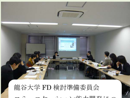
龍谷大学FD検討準備委員会 コミュニケーション能力開発についての報告会の様子