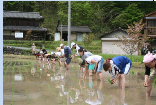
「モデルフォレスト推進プロジェクト」（美山）

2008年から始まったプロジェクトで、美山町で収穫された酒米（五百万石）を100%使用し、伏見の酒造会社の協力のもと、オリジナル日本酒を企画・立案・醸造するものです。参加学生は、酒米の酒米の田植えから収穫、ラベルデザイン、醸造体験、販売プロモーションに携わり、酒米の栽培から消費者の手元に届く一連のプロセスを体験します。今年も新酒が完成し、一般向けに販売中です。